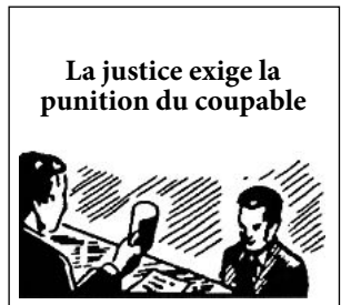
La justice exige la punition du coupable

Le péché attire le châtement. Dans sa justice, Dieu doit punir le pécheur ; la justice de chaque pays exige que soit puni celui qui transgresse la loi. Selon ce même principe, la justice exige que Dieu punisse le transgresseur de sa loi. Au jour du « juste jugement de Dieu », il rendra à chacun selon ses œuvres (Romains 2.5-8).